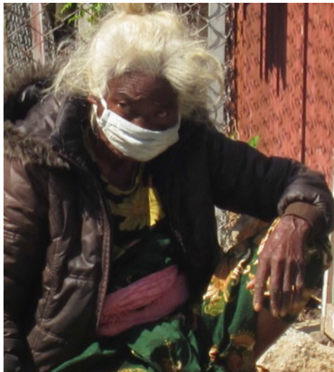
Tuberkulosepasientene må gå med maske for å redusere smittefaren på sykehuset. De fleste er innlagt bare en uke, og får resten av den seks måneder lange behandlingen på distriktshelseposten. Noen må imidlertid være innlagt to måneder.