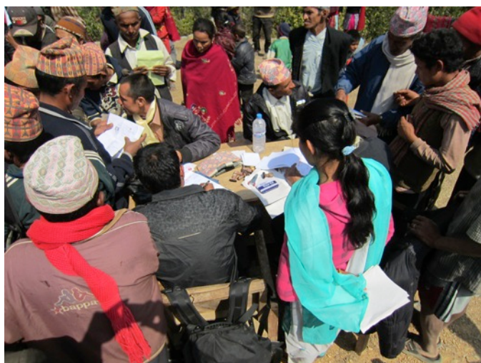
NAV-kontoret besto av et bord og en (for oss) ganske uoversiktlig kø.