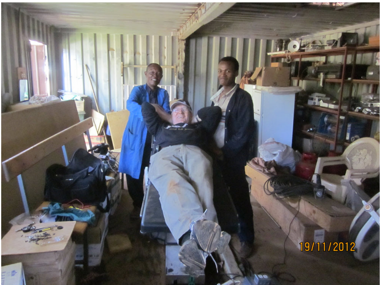
Olaf på operasjonsbordet sitt . . . .