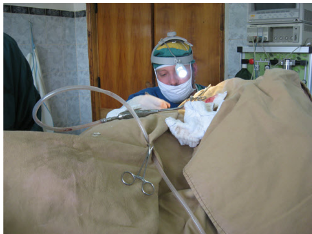
Bildet viser hjernekirurgen med superlim. Til opplysning må nevnes at superlim inneholder samme stoffer som også brukes som vevslim i vanlig kirurgisk praksis.

Lekkasjen av cerebrospinal-væske gav seg ikke og jeg opererte ham i forrige uke. Vanligvis vil jeg lage borrehull, sage ut og fjerne en bit av skallen, reparere hjernehinnen og legge tilbake skallebiten. Dette kunne ikke jeg gjøre på denne gutten på grunn av den vanskelige plasseringen av bruddet. Under operasjonen, mens gutten lå i narkose, sendte jeg derfor en av sykepleierne ut på markedet for å kjøpe superlim. Limtuben ble vasket i alkohol, en bønn ble sendt til vår Far i himmelen og deretter limte jeg sprekken i skallen med superlim.