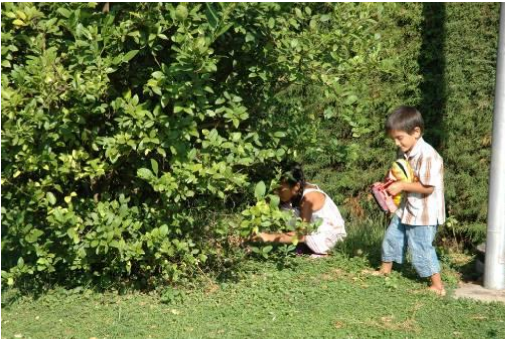
1. påskedag, barna leter etter påske-egg i hagen.

Ellers fikk vi også med oss noe av påskeprogrammet i kirken. 1. påskedag fikk hele familien være med på høytidsgudstjeneste i kirka her, det var en fin opplevelse. Gudstjenestene er lange, og ikke alltid