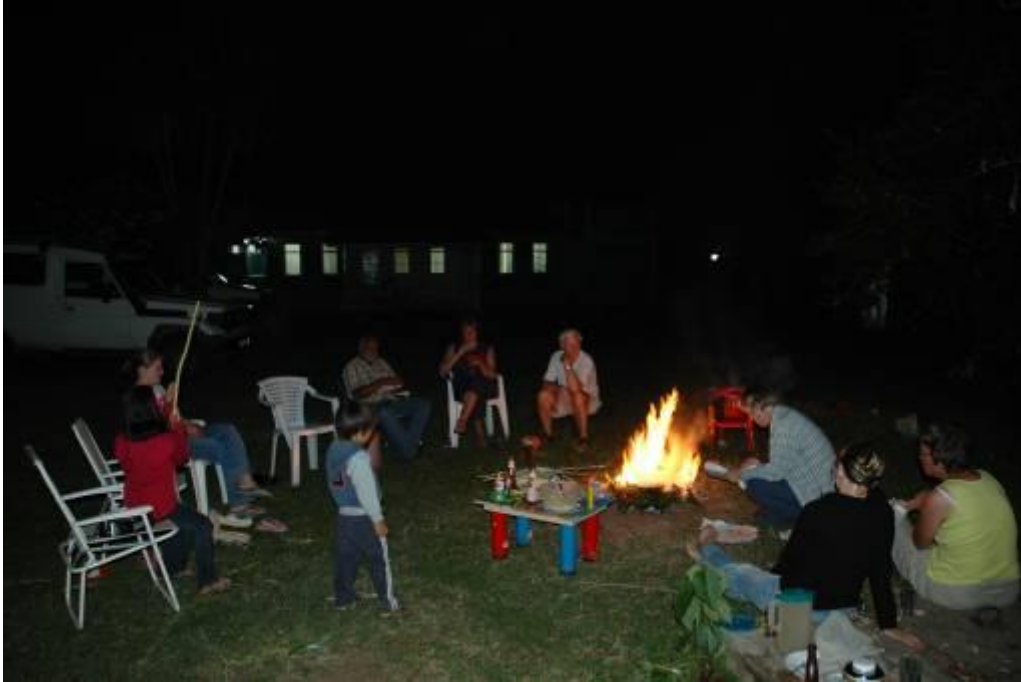
Grillfest påskeaften, 1400 meter over havet.