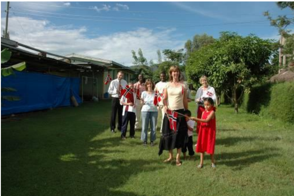
Totalt 11 i toget!