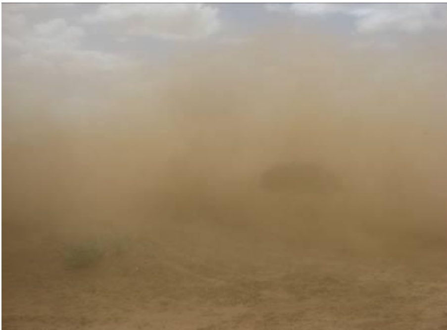
Støvsky i Omo Rate

Mens vi var der fikk vi også oppleve en ordentlig støvsky, plutselig var hele lufta fylt av støv.