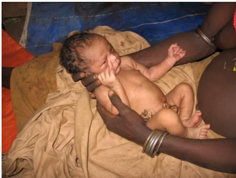
Det nyfødte mirakelbarnet.