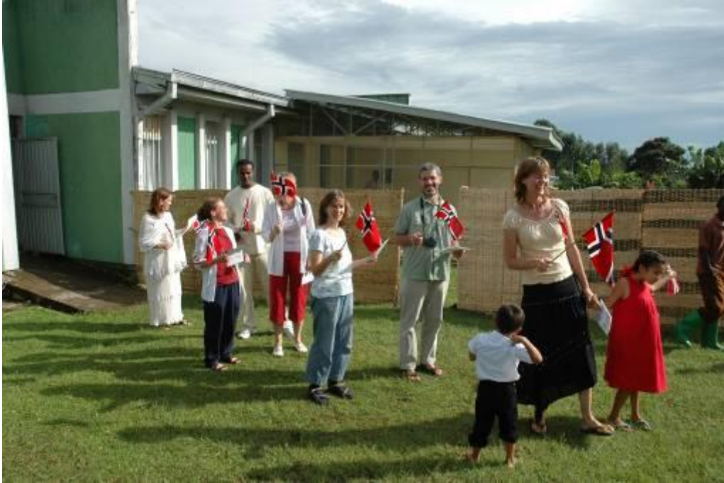
17. mai tog med skole og barnehage fremst i toget, fulgt av tyske misjonærer fra Maki, finsk og dansk misjonær i Jinka, en norsk misjonær og den etiopiske flyplass-sjefen til slutt.