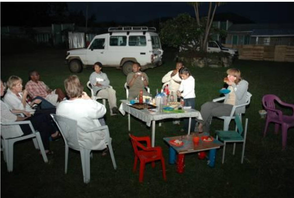
Avslutning med pølser og pizza i hagen.