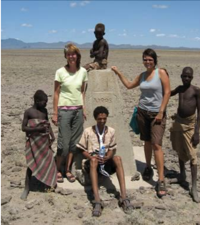
Grensestein med Kenya i bakgrunnen

Når vi kjørte i området der så vi mange kyr, sauer og geiter, de hadde store buskaper, dvs. at de som eide dyra var rike. De spiser ikke kjøttet, de slakter bare i forbindelse med store fester, for eksempel omskjærelses fester.