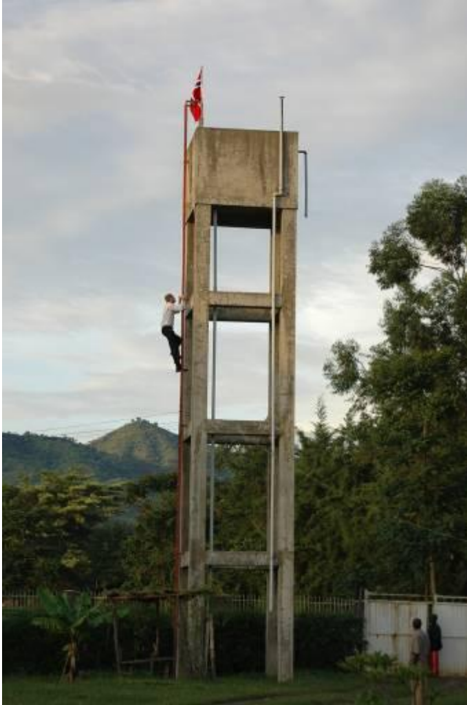
Flagget hentes ned, har noen høyere flaggstang hjemme?